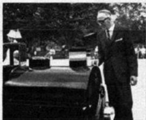
... På Skansen fångade Lilleputt-tåget transport-expertens intresse — men loket var ju bara en maskerad traktor...

gram i TV, det blev titt på utsikten från Fjällgatan med Stockholms vatten och kajer nedan, med Gamla stan i fön- den och Skeppsbron och Valdemarsudde i bakgrunden.